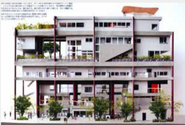
Grove 筋書のない建築への試行