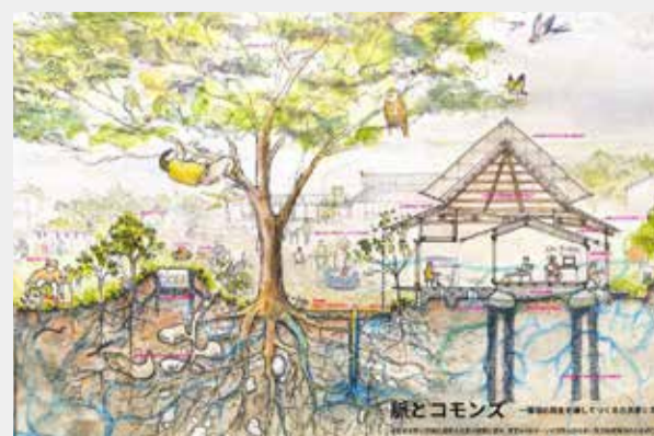
脈とcommons 循環の再生を通してつくる古民家と流域の未来