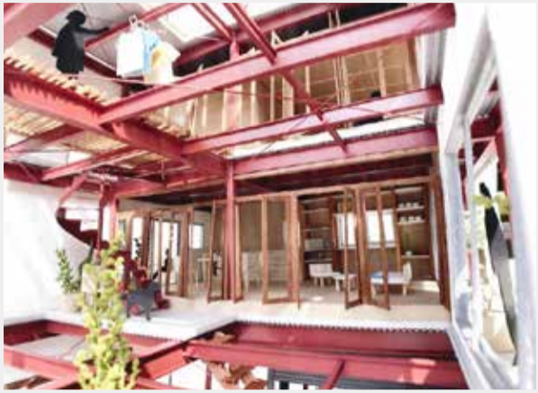
アッセンブルハウス