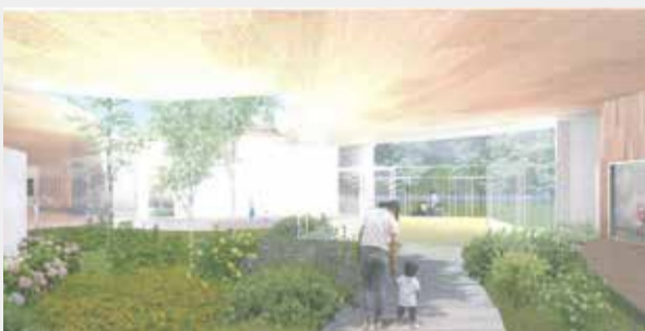
ひだまりこども園