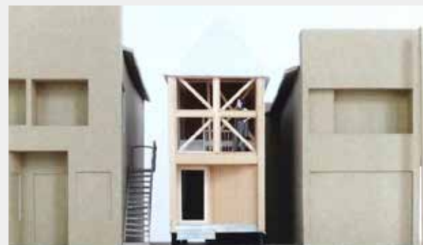
杭とトンガリ 都市の小さな土中環境再生