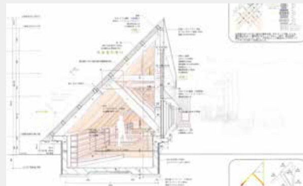
森の端のオフィス